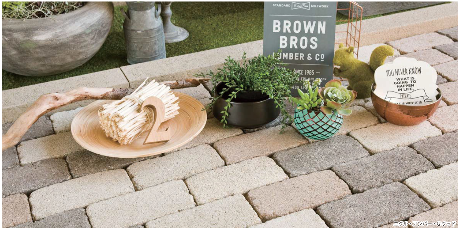
エクル・アンバー・Gウッド

丸くダメージをあたえた加工で、エイジング感のあるブリックをつくりました。ひとつひとつ形が違うので、ヴィンテージ風の使い込んだ風合いを楽しむことができます。スローな暮らしに溶け込む自然な色合い3色と赤系2色をご用意いたしました。